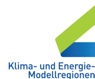
Klima- und Energie- Modellregionen Wir gestalten die Energiewende